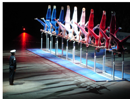
BRIGADE SPÉCIALE de GYMNASTIQUE de la Préfecture de Police de Paris